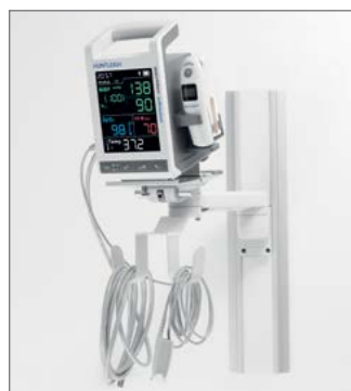
Väggmonteringsmöjlighet med krokar