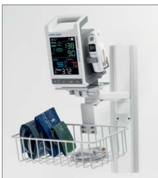
Väggmonteringsmöjlighet med korg

SC300 har en ökad flexibilitet genom urvalet för montering. Man kan välja mellan ett golvstativ med plats för tillbehör, väggfäste med korg eller krokar och ett stångfäste för begränsade utrymmen.