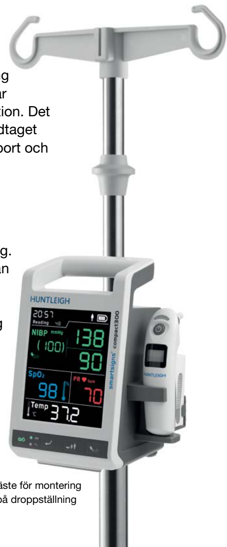
Fäste för montering på droppställning