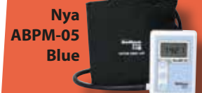
Nya ABPM-05 Blue