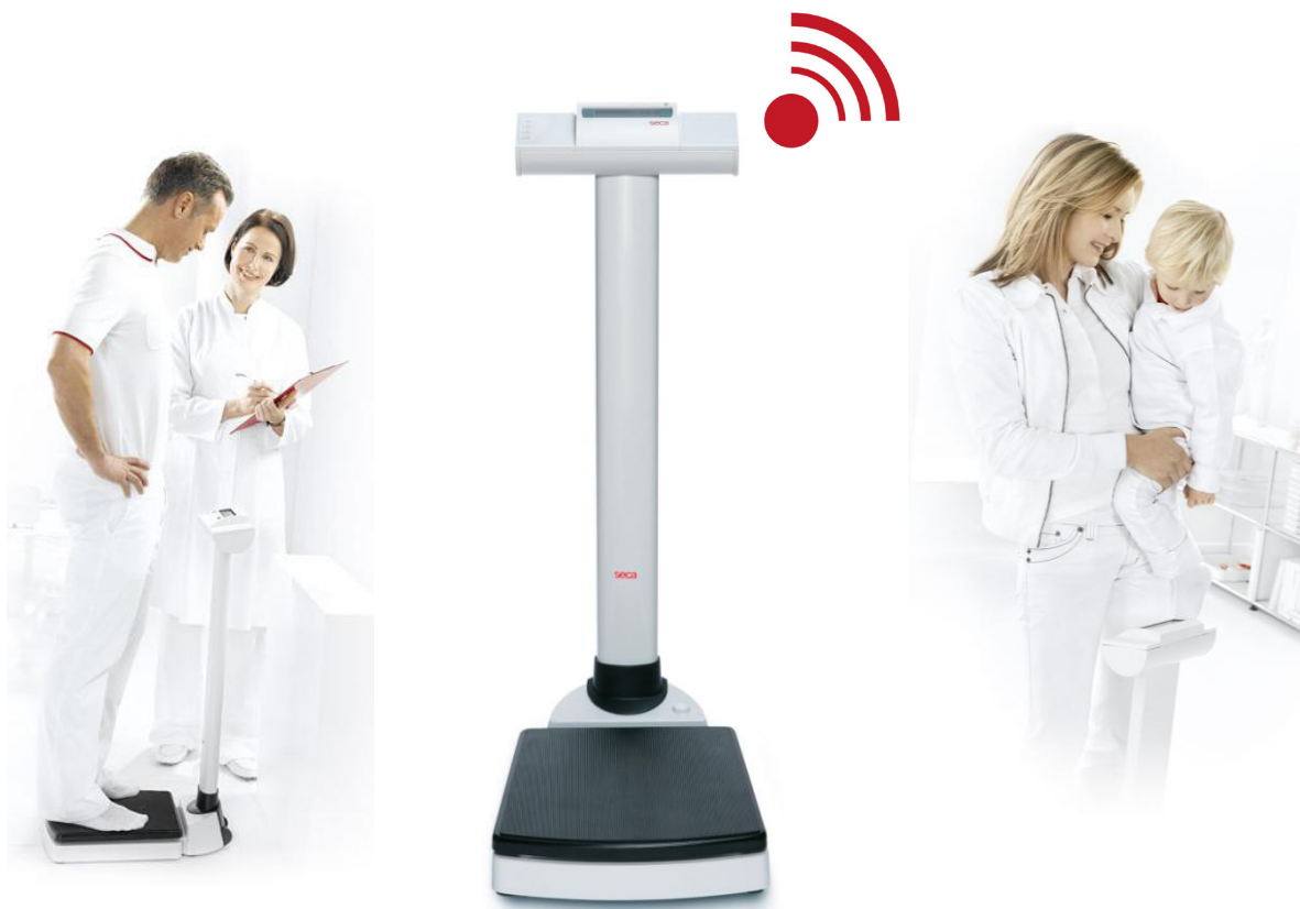
Art. nr. 7013