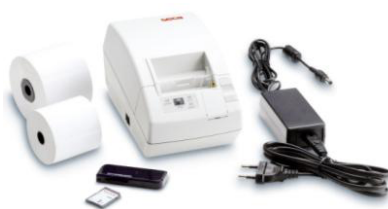
seca 465/seca 466 skrivare för termopapper eller termopapper/etikett