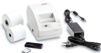
seca 465/seca 466 skrivare

CE : seca 264 och seca 274 wireless uppfyller direktivet 93/42/EEG, MDD .